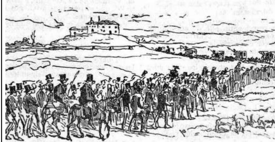
Sus partidarios acuden a Tablada para que acepte el nombramiento de Presidente del Gobierno. (Revista Gil Blas , 7-7-1872, 1)

Cuando se restaura la monarquía borbónica se exilia a Francia y funda el Partido Republicano Progresista, promoviendo conspiraciones que fracasan. Solo volverá para morir en Burgos en 1895.