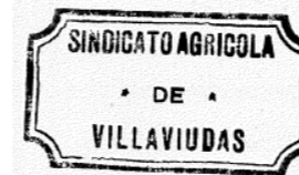
Sello del Sindicato