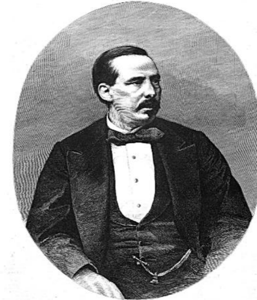
Manuel Ruiz Zorrilla en 1872, Burgo de Osma (Soria) 1833- Burgos, 1895